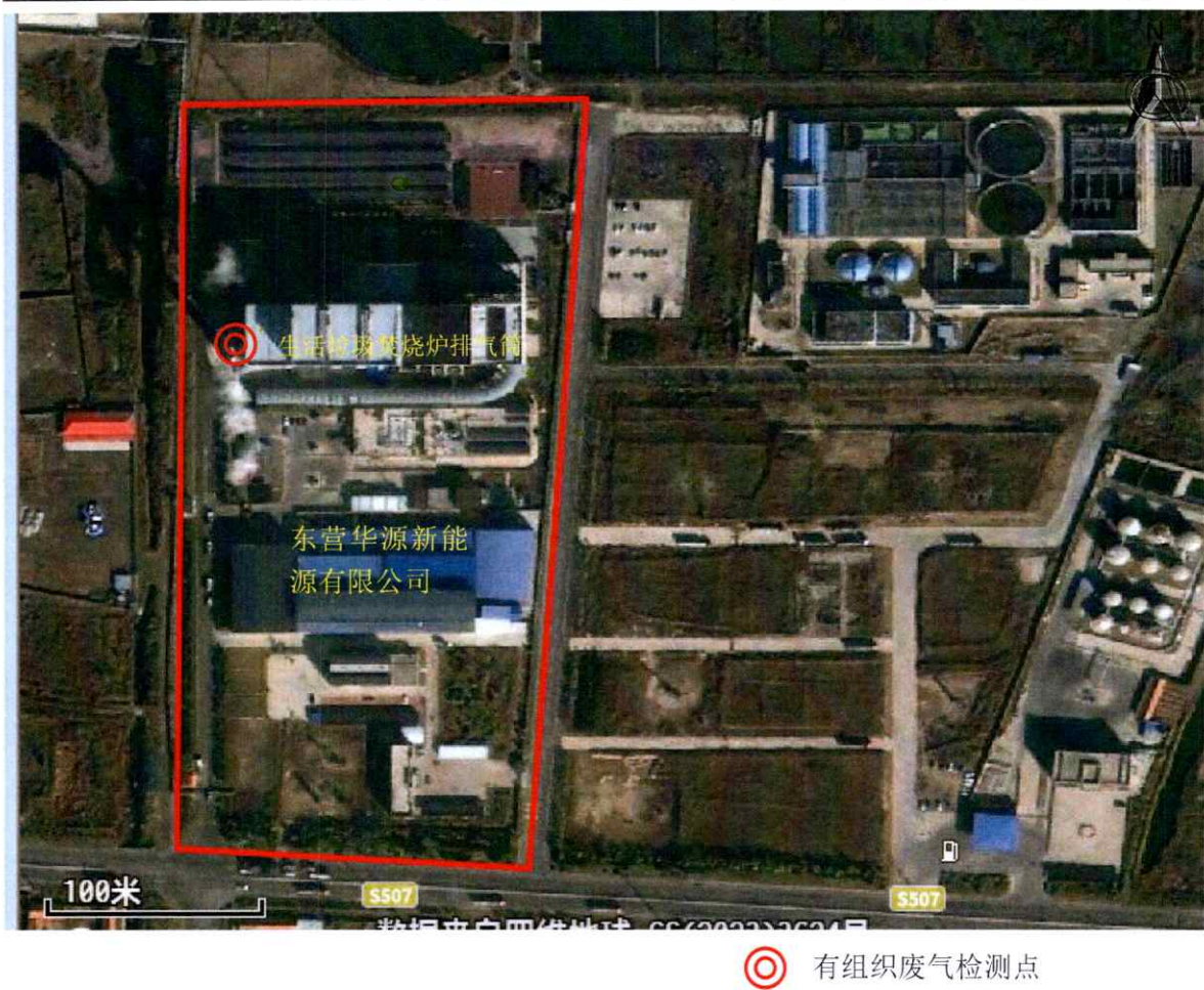
图 1 有组织废气检测点位示意图