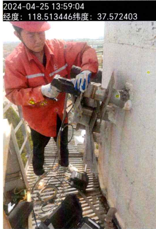
图 2 现场采样照片