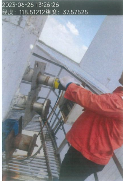
图 1 现场采样照片